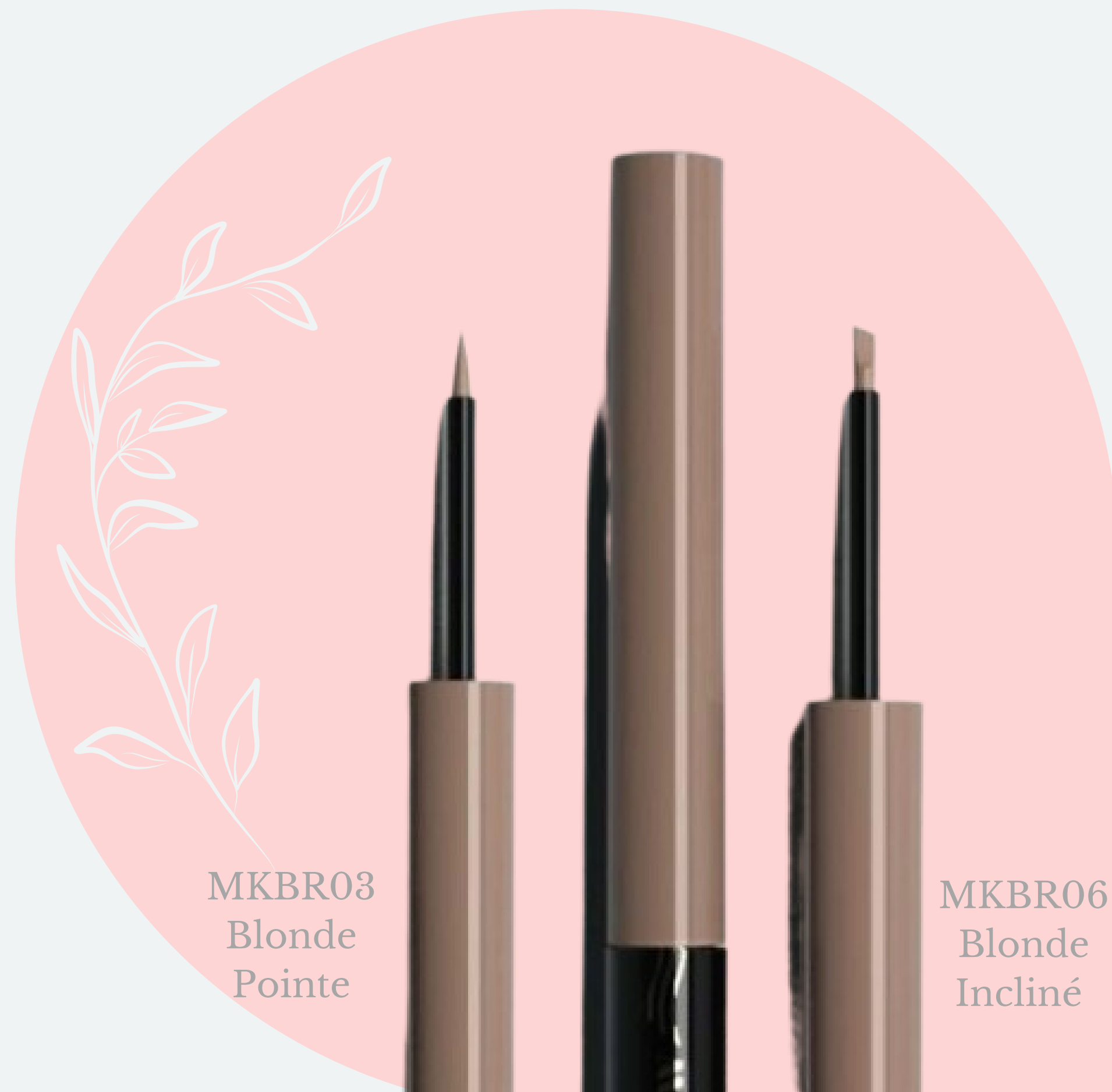
MKBR03 Blonde Pointe

Il est idéal pour remplacer le crayon pour les sourcils ; disponible avec une brosse pointue ou inclinée